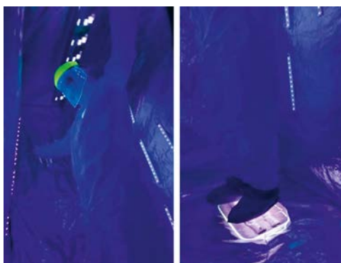
Figure 2 . Tente de Décontamination SARS-CoV-2, UVC, Wuhan, mars 2020.