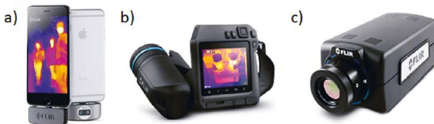
Figure 1. Exemples de caméras infrarouge commerciales : a) module pour smartphone ; b) caméra thermique compacte portable ; c) caméra thermique refroidie hautes performances.

l'objectif est réalisé avec des matériaux spécifiques à l'infrarouge, tels que le germanium (Ge) ou le sélénure de zinc (ZnSe). La matrice de détecteurs, quant à elle, doit utiliser un autre matériau absorbant que le silicium, qui n'est plus sensible au-delà de 1,1 \mu\text{m} . Les semiconducteurs candidats ne manquent pas, d'où l'existence d'un nombre important de filières technologiques, chacune ayant ses avantages et ses inconvénients.