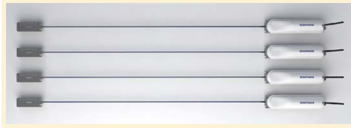
Figure 1. Corde optique LIRIS.

Wavefront sensors and adaptive optics for optical metrology, lasers and microscopy