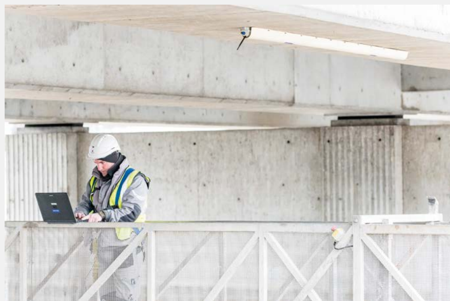
Monitoring Pont Saint Jacques, Montluçon.

Après six mois d'instrumentation, l'étude a permis d'analyser l'effet des variations saisonnières de température ainsi que celui des véhicules lourds (environ 50 convois par semaine ont un tonnage estimé à plus de 20 tonnes; les effets de ces convois sont visibles à la fois à mi-travée où les plus lourds génèrent une déformation de 0,175 ‰, et sur les diagonales d'about où ils génèrent une déformation de 0,043 ‰; ces ordres de grandeur correspondent à des déformations acceptables pour une structure en béton armé sous l'effet de charges d'exploitation). Enfin, le retour à l'état initial du tablier est constaté après l'ensemble des passages, et les effets de ces derniers sont stables au cours du temps.