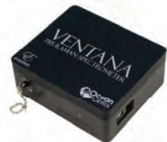
Ventana: Throughput and Sensitivity