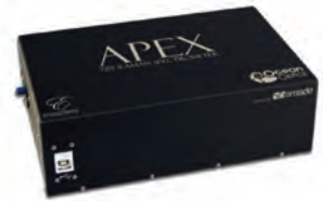
Apex: Sensitivity and Resolution

Introducing the new high performance spectrometers family