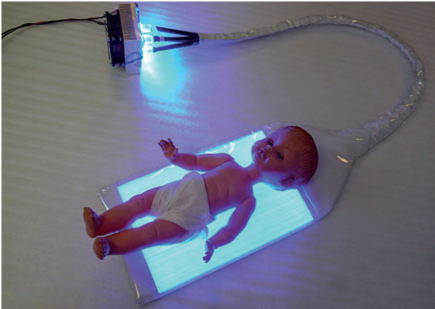
Figure 1. Photo du pad de photothérapie.

Le principe des fibres optiques est de conduire la lumière dans le tissu. Afin d'être rendu lumineux, le tissu subit un traitement de surface.