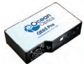
QE65Pro: high SNR and long integration time