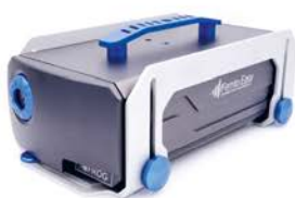
FROG mono-coup et multi-coup