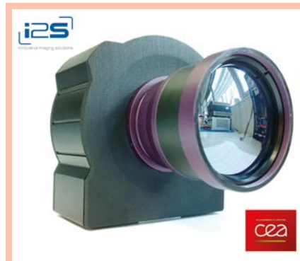
Figure 2. Caméra TZCAM de I2S intégrant la technologie de capteurs matriciels bolométriques du CEA-Leti et une optique f/0,8.

Les caméras THz non refroidies peuvent remédier à ces freins 'marché' mais requièrent en contrepartie l'utilisation de sources d'illumination externe. En correspondance à un essor de sources commerciales, une dizaine de caméras non refroidies sont actuellement disponibles commercialement (cf. tableau en fin d'article).