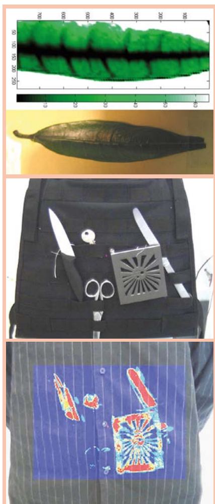
Figure 1. Exemples d'images THz (réalisées avec les capteurs CEA-Leti). (a) Feuille en transmission. (b) Image visible d'objets cachés sur un buste. (c) Image THz brute des objets cachés sous une chemise.